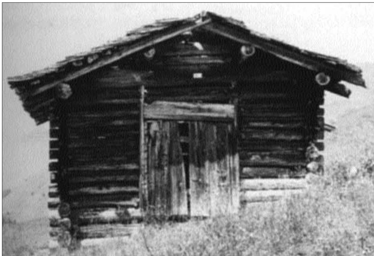
Clavà en Scanvetg.

Il cudesch descriva ils mises be fin a l'onn 1960. El n'entra betg sin la mida da ch'è succedida la fin da l'ultim tschientaner.