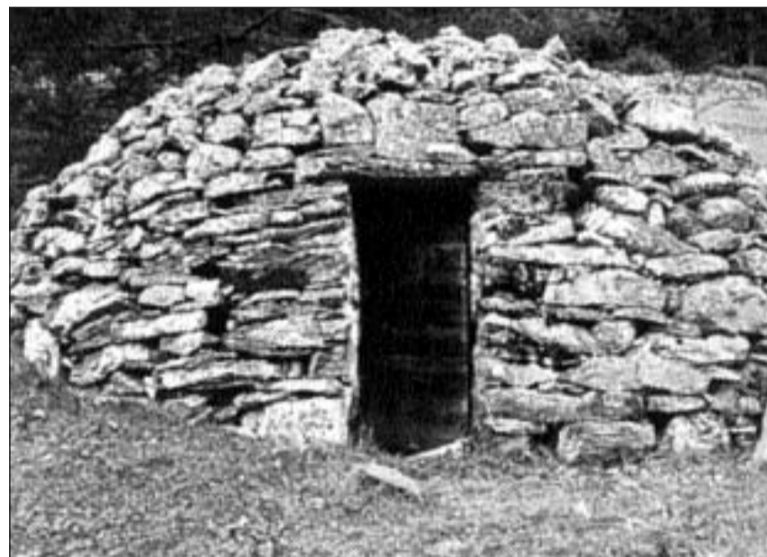
Tschaler da chaschiel en Val Poschiavo.