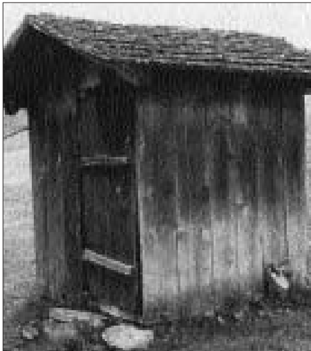
Fecler per cuschnar en Val Medel.