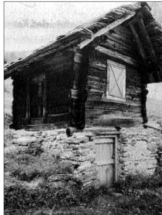
Buseno, en la vischnanca San Carlo.